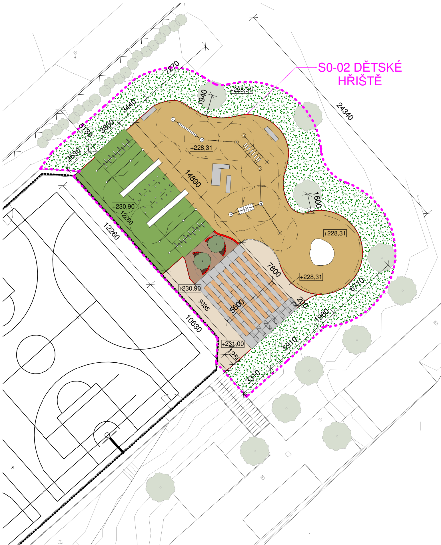
S0-02 DĚTSKÉ HŘIŠTĚ